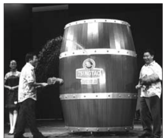
日照第三届青岛啤酒节8月2日晚开幕。

为了配合8月11日青岛国际啤酒节的全国酒王争霸赛总决赛,日照酒王争霸赛决赛将在8月7日举行。喝酒够快就来挑战你的汽车大奖吧!