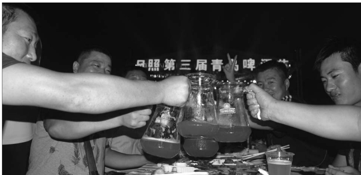
啤酒节上,市民和游客尽情享受青岛啤酒带来的快乐。

本报8月4日讯(见习记者 杜光鹏)“青岛啤酒节开幕啦!”激情再次引爆日照。8月2日,日照第三届青岛啤酒节在日照开发区中心广场全面启动,啤酒狂欢一直持续到8月11日。