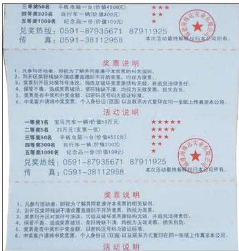
▲奖券正面(左)、奖券背面(右)。