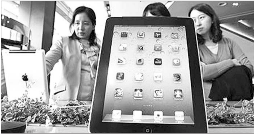
韩国首尔的民众在试用ipad 2。(资料片)

望获得使用许可的人,“公正、合理、非歧视性地”出售许可。美国法院还裁决,此类专利不能成为进口禁令的基础。