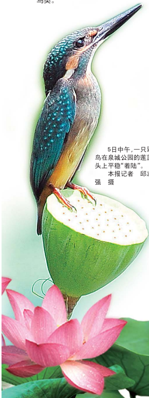
5日中午,一只翠鸟在泉城公园的莲蓬头上平稳“着陆”。