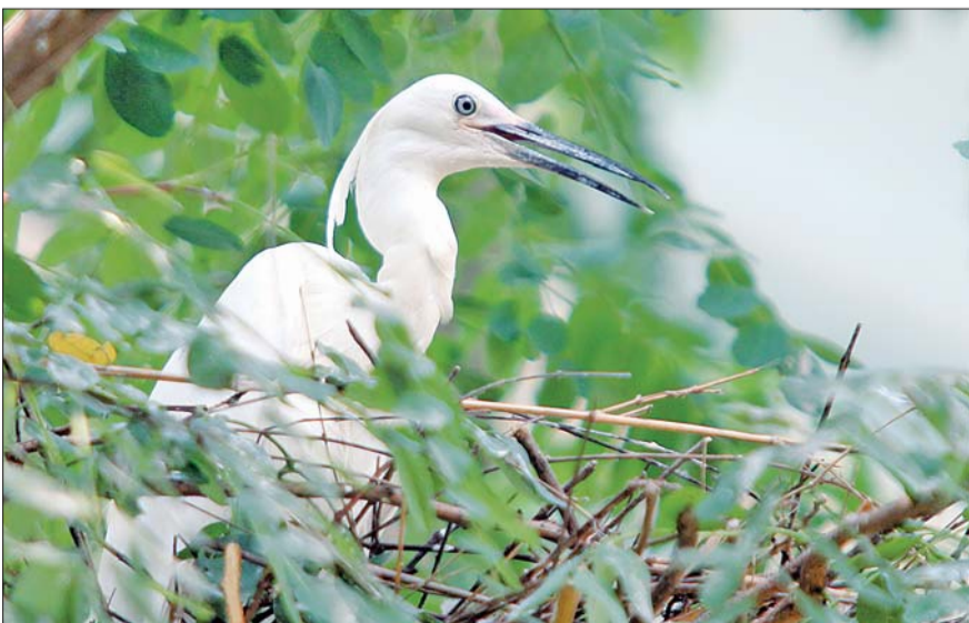
珍珠泉边的白鹤。