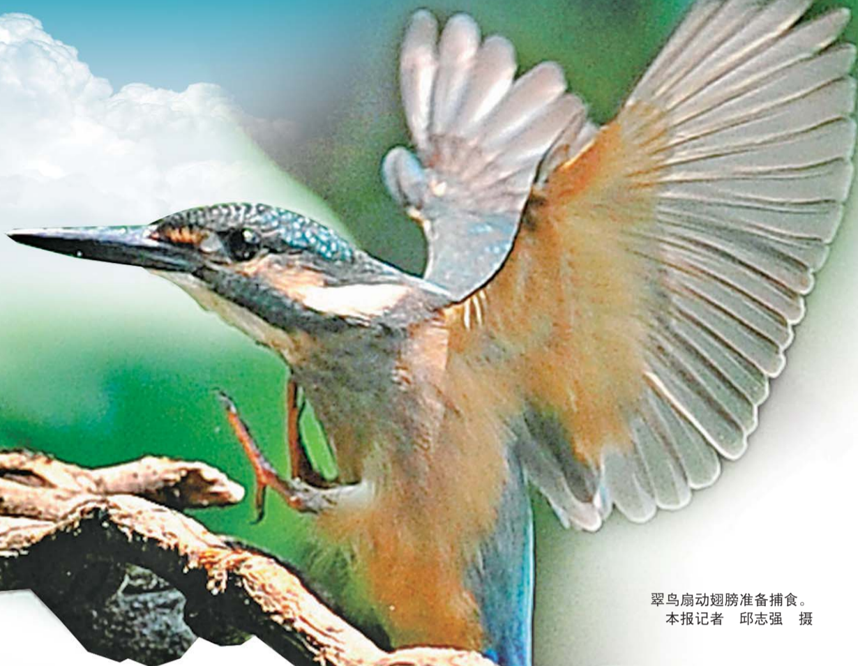
翠鸟扇动翅膀准备捕食。