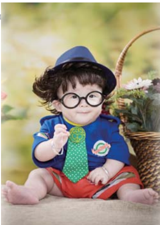
金宝贝儿童摄影具有良好的业务能力。