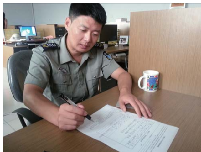
▲雷先生正在填写相亲会报名表。

“如果女方有房的话,我可以到女方家住。”雷先生告诉记者,他家里有房子,工资还行,他对于婚房的要求并不高,他认为两口子过日子在哪住都行。