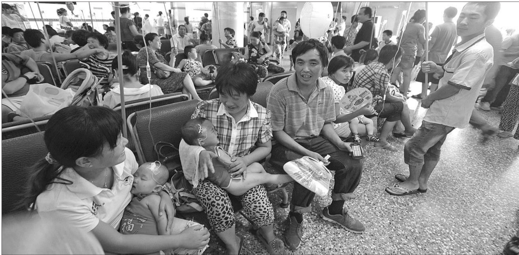
6日,济南儿童医院输液室里挤满了孩子和家。连续高温,该院每天接诊量达到3000多人次,比平时增加了10%以上。

这两天不少市民感慨:太热了,街上走一圈,撒点孜然,就能变身“烤肉串”啊!6日,济南又是一个晴热高温天,甚至呆在空调房里都能感觉有汗流出,但当日预报的济南最高气温才35.6℃。体感温度为何与预报气温差别那么大?气象台发布的预报气温是咋得出来的?看看记者的探访吧。