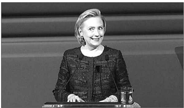
6月3日,2013美国时装设计师协会颁奖礼。众多名模纷纷上台,嘉宾云集,前国务卿希拉里现身领奖礼。

普里伯斯要求,CNN和NBC在本月14日共和党全国委员会会议前中止播出计划。否则,他将在会上推动一项决议,要求共和党2016年不再参与这两家媒体参与举办的总统选举电视辩论,甚至抵制它