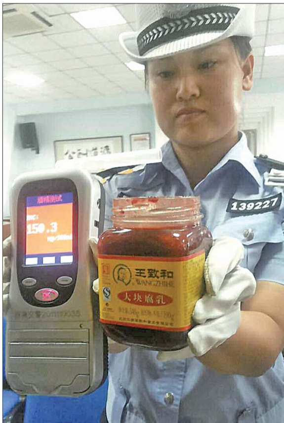
吃完豆腐乳,酒测结果很高。

通过数据对比,在不喝酒的情况下,尽管有些食物或药品在使用后确实会对酒精测试结果产生较大影响,例如藿香正气水以及口喷剂,但一段时间之后,酒精成分的影响就会消除。