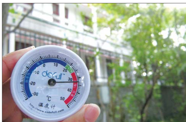
下午2点16分,南山公园温度仅32℃。本报记者 李楠楠 摄

体感情况:学生公寓附近遮阳处较少,记者在遮阳伞下仍觉得“烤”,遮阳伞遮不到的腿部被晒得发红,寝室外台阶被晒得烫手。