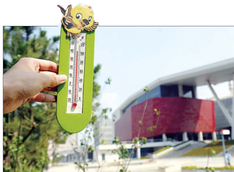
6日下午2点05分,烟台文化中心广场,温度计显示42℃。

进入8月,烟台开启高温模式,作为避暑胜地的烟台,哪里比较热?哪里凉快?6日下午,本报记者兵分多路,随机选取一些地点进行测试,发现车流不息的宫家岛立交桥气温高达44℃,而南山公园32℃,相差12℃。本次测试选在下午2点-2点30分,均为室外温度。测试过程中,记者手持温度计离地1.5米左右,并且尽量避免让阳光直射温度计,测试5-10分钟待温度计数值稳定后读取数据。