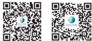
烟台微信圈子 微博烟台早知道