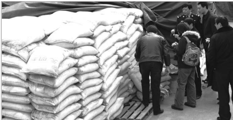
民警在莱州调查非法经营食盐案。

前不久,公安部转发推广了烟台市公安局的工作经验,河北省公安厅还专门邀请烟台市公安局经侦支队前去介绍“运用情报信息开展打击侵权假冒专项行动”的成功做法,他们的经验做法得到了相关部门的高度赞扬和肯定。