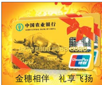
金穗相伴 礼享飞扬

对2013年4月1日—2013年12月31日期间,以累计消费积分满200万分(消费1元积1分,下同)为起始标准,对进入全国消费积分前50名的IC借记卡钻石卡持卡人回馈“传世之宝”10g金条一枚;以累计消费积分满100万分为起始标准,对进入全国消费积分前100名的白金及以上级别IC借记卡持卡人可回馈“传世之宝”5g金条一枚;以累计消费积分满50万分为起始标准,对进入全国消费积分前200名的金卡及以上级别IC借记卡持卡人可回馈“传世之宝”3g金