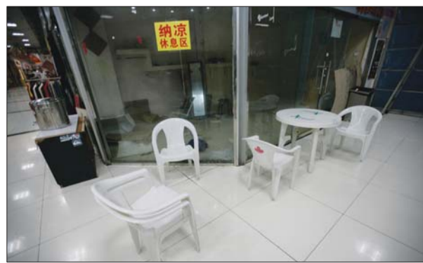
6日,在龙山地下商街设置的纳凉休息区内少有市民前来纳凉。本报记者 张晓鹏 摄

记者在中山路附近采访几十位市民,当提及“免费纳凉点”时,部分市民称“不知道”。有大多数市民认为,青岛和南方那些高温城市比,算得上凉快了。“虽然说有30度,但相对那些40度的好多了。”不少市民认为,热了随便找个没太阳的地