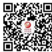
扫描二维码加齐鲁晚报今日莱芜好友