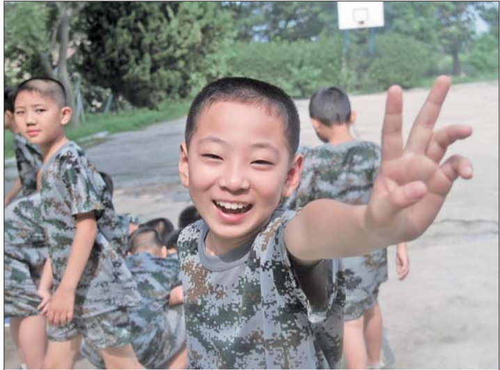
▲虽然离开军营会有不舍,但是一想到很快就要回家,孩子们都很高兴。

行驶在大海中,营员像第一次进发刘公岛一样,站在船舱外不停地拍照。七天前的拍照,是对海岛的探索,今天的留影,是对军营的留恋。