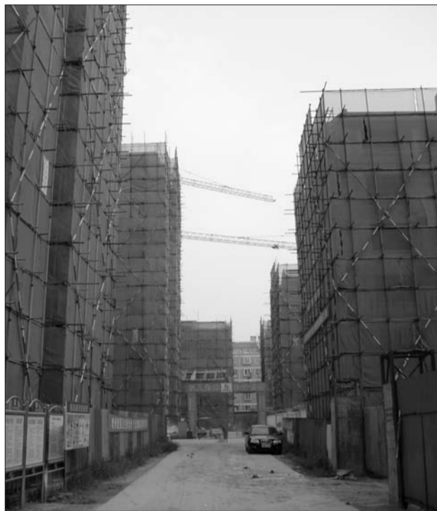
一期经适房主体已完工,正在装饰。

另外,辛明告诉记者,在医疗方面,小区距昌国医院和第四人民医院都比较近,只有几百米的路程;娱乐设施方面,距离都市名苑最近的是吉田园,拥有赛马场、自种菜园等多样娱乐场所供居民选择。“在购物方面,都市名苑毗邻淄博商厦分店,以及在九月份即将开业的麦德隆超市,非常方便居民生活。”