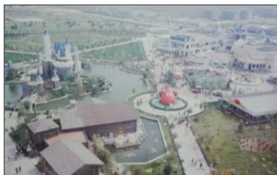
▲上世纪90年代的富华游乐园