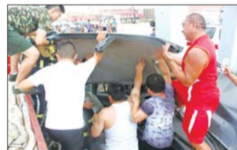
众人掀开车顶救出被困男子。

本报热线6610123消息(通讯员 刘新强 刘晓龙 记者 苑菲菲) 6日下午3点左右,招远市张星镇政府驻地中石化加油站东侧,一辆轿车在行驶过程中失去控制,撞向路边加油站室外顶棚立柱上,油箱泄漏,驾驶员被困。经招远市公安消防大队救援,驾驶员被成功救出。