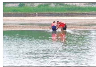
消防人员正在打捞尸体。

本报热线6610123消息(记者 苑菲菲) 7日下午5点左右,青年南路附近夹河上出现一具尸体,消防人员将尸体打捞上岸。据悉,死者是名十三四岁的男孩,死亡约半个多月。