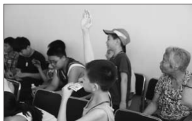
小记者们踊跃回答问题。