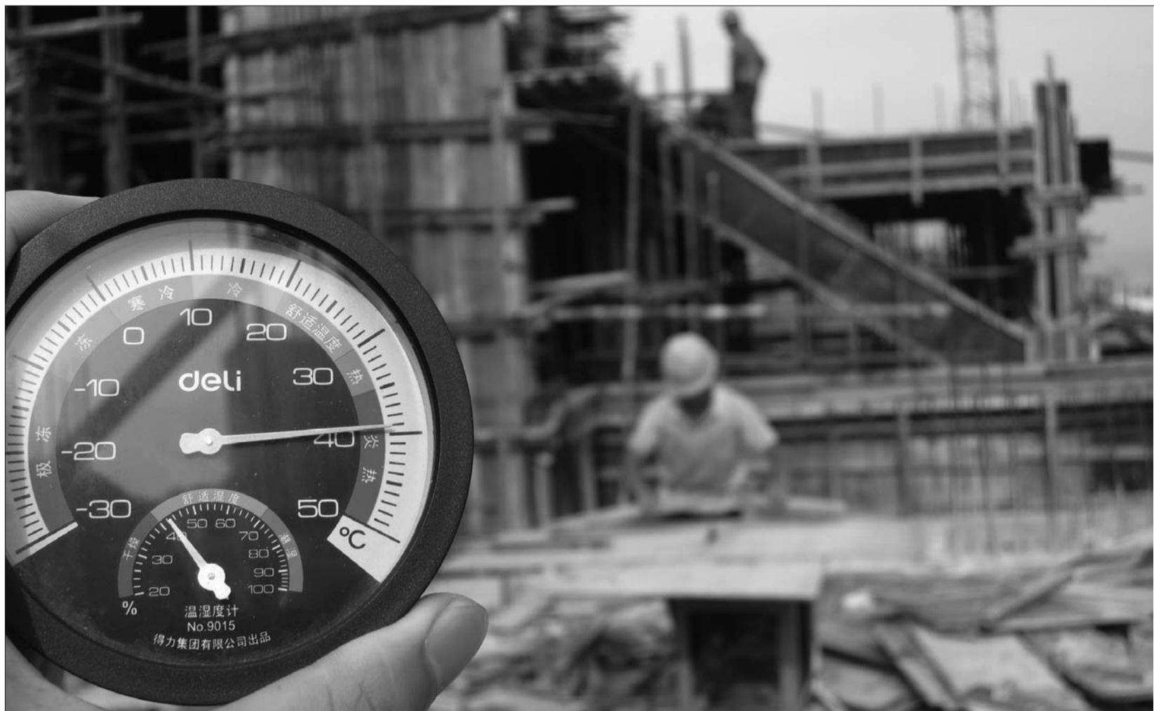
▲记者携带温度计到莱芜一建筑工地楼顶测温,温度很快逼近40摄氏度。