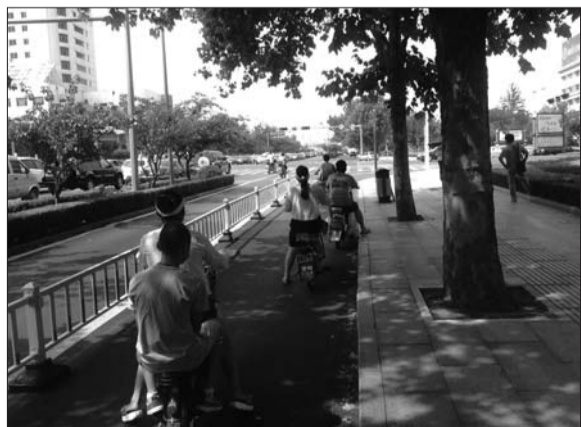
▲7日中午因天气炎热,在文化北路龙潭大街路口,很多市民选择在离路口有一段距离的树荫下等红灯。见习记者 王浩奇 摄

本报8月7日讯(见习记者 徐莹 张群)记者从莱芜市气象台获悉,7日最高气温为35摄氏度,出现在当日下午两点到三点之间,这也是入夏以来莱芜市的最高温度。记者在一建筑工地测得的温度接近了40℃。