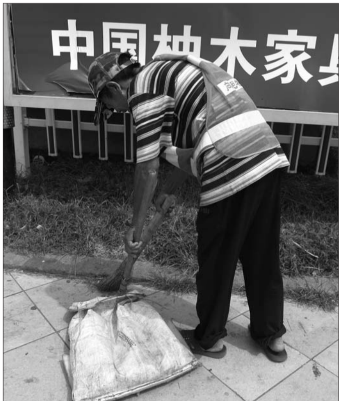
▲高温下,环卫工人在市政府广场前坚持工作。

医生称,高温环境下,为了减少肠胃炎的发病机率,大家不要吃太杂。另外,建议大家减少室外活动的的时间,心脑血管病人尤其要注意这一点。