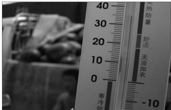
▲上午在一西瓜摊前,温度达到了35摄氏度。