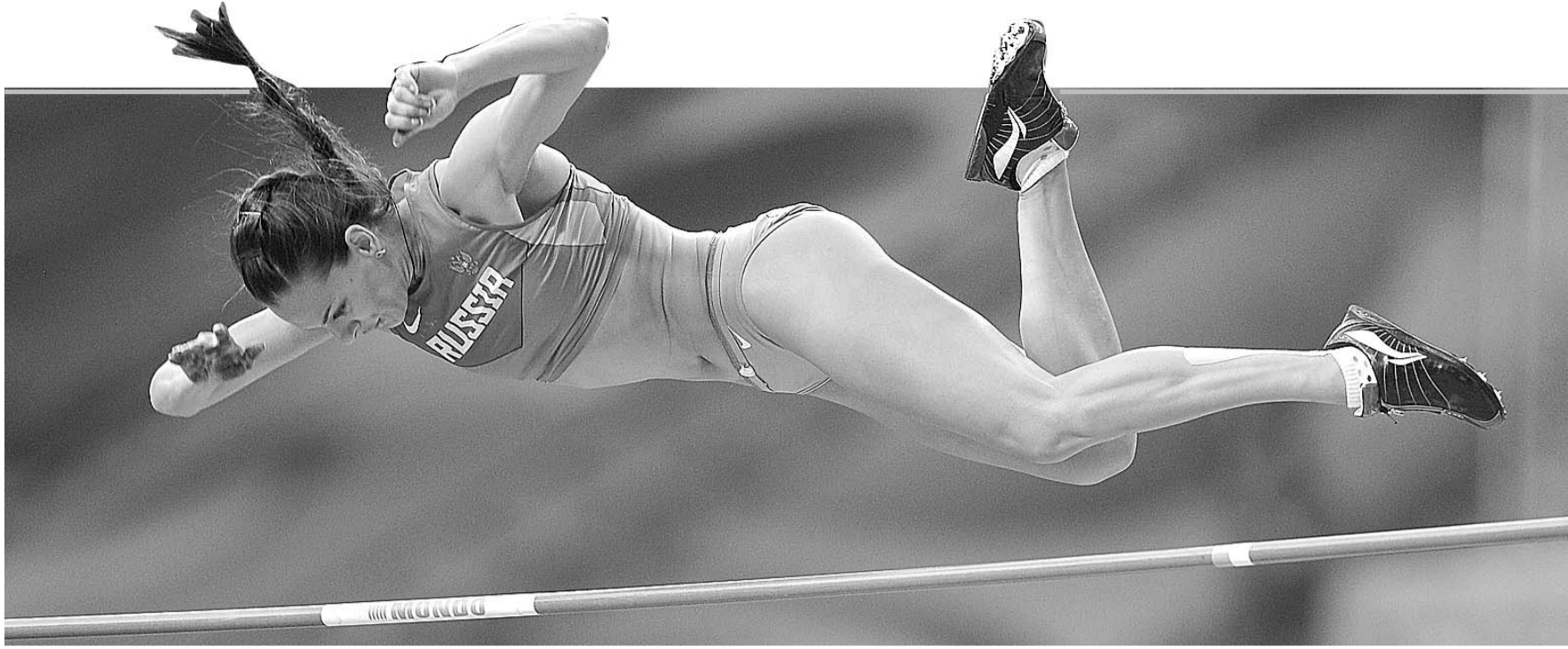
伊辛巴耶娃越过横杆,在空中秀出最美的舞姿。