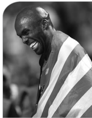
男子400米决赛,美国选手梅里特一路领先,以43秒74的今年世界最好成绩夺冠,时隔四年后重夺世锦赛冠军。