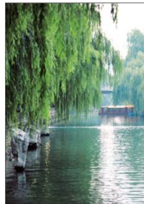
▲护城河边柳树还不少。

呢?”安吉磊表示,杨树和柳树的对比一直在降低,但市民仍然有飘絮增多的感觉。主要是城市硬化路面多,缺乏泥土,绿地对杨絮的吸附,杨絮吹下去又被吹起来,反反复复,显得很多。今年春天有两场雨雪,飘絮被打湿后再也飘不起来,显得飞絮少了。