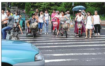
14日, 泉城路十字路口行人较多, 有关部门将规划对角斑马线。本报记者 周青先 摄

据了解, 今年历下区设立3000万元专项资金, 对困难群体实施大病救助。为低保人员每人每年设立200元医疗卡, 为低保边缘人员每人每年设立100元医疗卡, 实现低保家庭成员大病全救助, 低保边缘家庭成员大病费用绝大部分由政府承担。