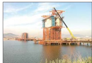
施工中的双岛湾特大桥主墩。

提起秦山隧道,几乎所有关心青荣城铁建设的人都知道,它是山东省内最长的隧道。秦山隧道总长度有5.5公里,起点在黄务街道刘家村,终点在新桥西路肉联加工厂附近。作为“山东第一隧”,秦山隧道不能简单采用一头推进的施工方式,而是采用了斜井施工。据了解,秦山隧道施工时,在两头开挖的同时,又从隧道的中间部位开挖斜井,形成了4个作业面,大大加快了工程进度。 在秦山隧道进口处,中铁二十局青荣城铁二项目部的白队长向记者介绍了工程的最新进展。“我们负责的1575米施工段内,已掘进了1103米,现在正以每天3米左右的进度延伸。”白队长说,预计在11月底,秦山隧道就会全线贯通。