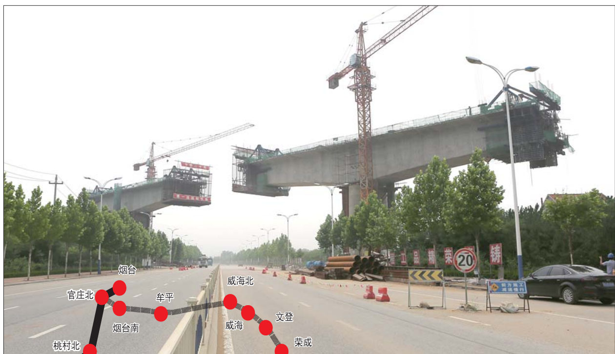
青荣城铁跨越青年南路南头的“百米跨”施工现场。