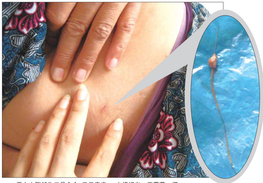
于女士腹部伤口虽愈合,但仍疼痛。

于女士说自绝育手术后,就再也没有做过任何手术。因没检查出原因,丈夫对她颇有微词。“老觉得我是故意说疼,偷懒不去干农活,吵了好些架了。”于女士说,手术是在龙口市原大陈家镇卫生院做的,现在这个卫生院已经合并到了北马中心卫生院。当年的主刀医生不在了,其他医生或退休或转院了。