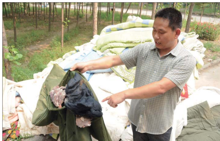
工作人员拿着“黑心棉”制品讲解“黑心棉”的危害。