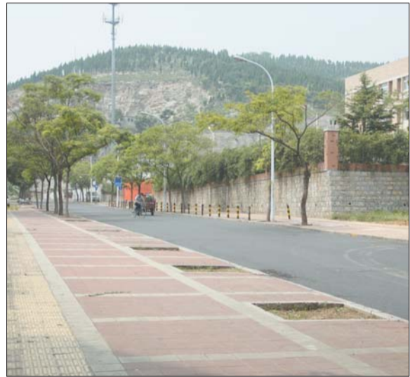
在舜文中学门口的道路上,不少树坑闲置。

据舜耕街道办事处工作人员介绍,该路段以及附近的舜世路均属于三联集团城建开发总公司,还未移交到市政部门。但由于该公司经济条件有限,无力负责这些道路的整修维护,目前这些道路由办事处接管。“上周六,我们对舜文中学门前道路进行整修并铺上了沥青。对于不少行道树枯死,我们打算协调相关单位在适合的时节进行补植。”