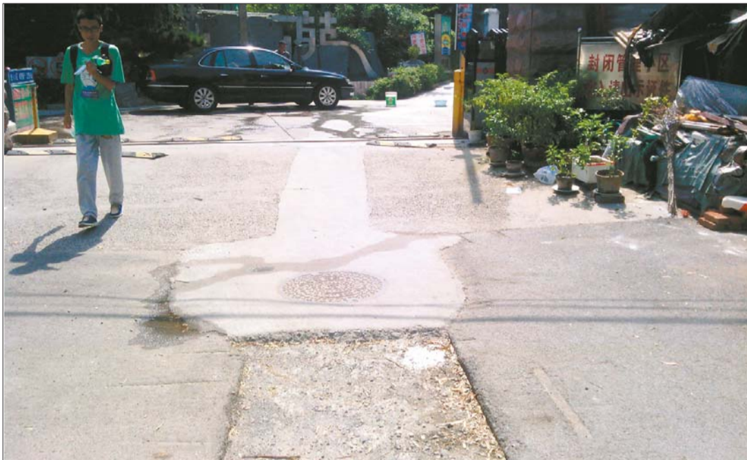
历山苑小区道路施工后在居民的一再关注下只铺设了一层水泥,至今尚未铺设沥青。

近期,多位市民向本报反映,道路管道施工后渣土回填,但路面迟迟没有硬化,道路坑洼不平,市民出行“步步惊心”。专家认为,市政部门应该明确责任,严格执行“谁施工谁硬化”的规定,如果没人硬化,市政道路养护部门应该兜底。