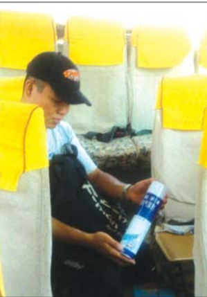
南关汽车站,杀虫剂空瓶可直接带上车。

16日下午3点10分左右,南关汽车站东侧停有两辆客车,一辆发往岱岳区北腾村的客车车门打开,司机在车外乘凉,车上有几名乘客等着发车。