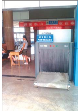
泰安汽车西站进站口,安全检查检测设备没有开启,工作人员在闲聊。

记者在大厅找了多次,没看到安检机,几名工作人员坐在大厅门口聊天。乘客买完票后,拿着行李在大厅候车区等车,车来了之后,乘客拿着行李直接上车,期间并没有工作人员对所带行李进行检查。一位乘客说,他在泰安上班,家是新泰的,每周