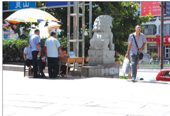
交通宾馆汽车站,4个安检人员都没对提包乘客进行安检。

17日和18日,记者两次携带“违禁品”进出交通宾馆汽车站,虽然车站的两个出口都有安检人员,但并未对乘客逐一检测,南侧出口半个小时内没有安检一人,记者携带空瓶杀虫剂成功登上去肥城的中巴车。