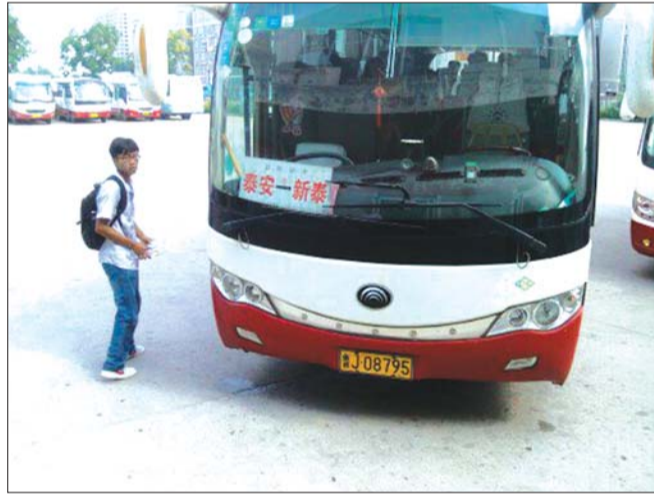
小井汽车站,乘客买完票就可直接上车。

时间:16日下午2点30分 地点:泰安小井汽车站 暗访情况:没有安检机,工作人员称有手持安检仪,乘客上车时并没有人安检。