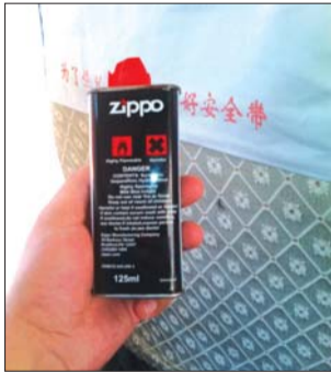
记者从泰安新汽车站的出口顺利将打火机油空瓶带上车。

记者随后从出入口顺利进入停车场,不少车车门大开,一些准备发车的车门口站着司机和工作人员,车里坐了不要乘客,司机和工作人员没有要求检查记者的行李。8点42分,记者顺利将打火机油空瓶带上车。