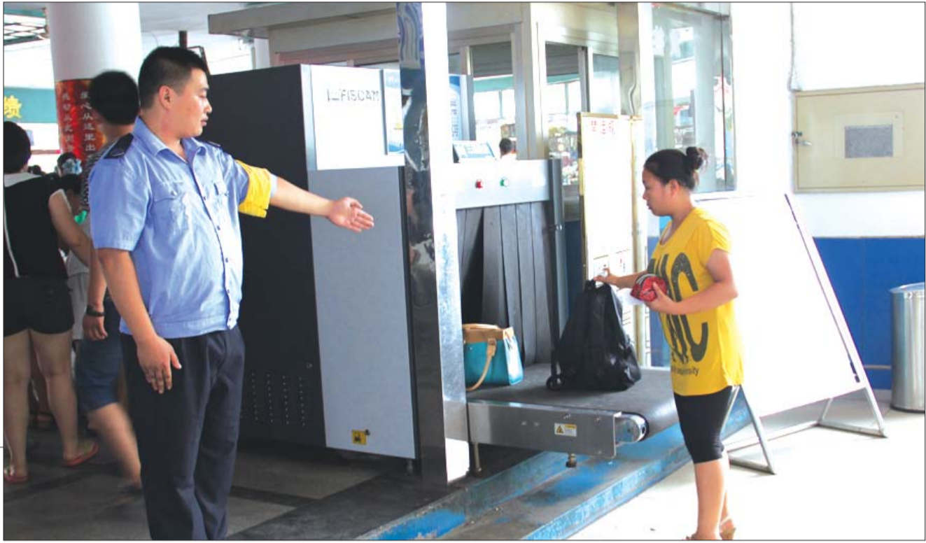
▶老汽车站,安检人员引导乘客进行安检。

15日,泰安市交通局暗访发现,泰城三个车站安检不到位,暗访人员带着易燃物可通过汽车站安检。16日、17日,本报派出四名记者,对泰城8家车站(小井汽车站、南关汽车站、老汽车站、泰山汽车站、交通宾馆汽车站、泰安汽车西站、新汽车站和泰安高铁汽车站)进行暗访。调查发现,有两家车站安检比较到位;两家虽有安检设备,但没有运行;三家现场没有看到安检仪,乘客上下车、进站很随意,杀虫剂瓶子轻松带上车;一家进站口安检比较严格,但出站口乘客可随意进入。