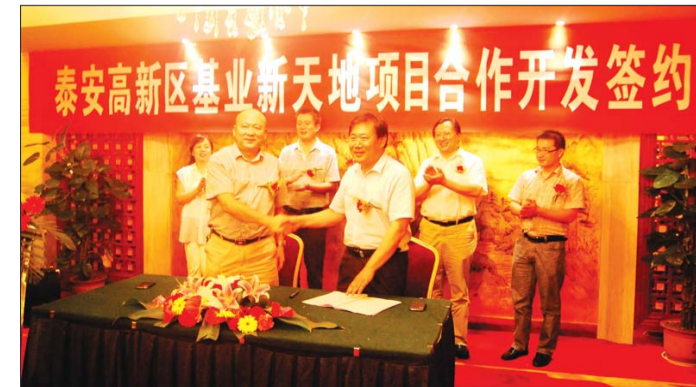
安居房产与泰山基业正式“联姻”。

据了解,安居房产现有上上城、幸福里、金城缙香三个在建项目,在建面积60万平方米,每年开发量在15