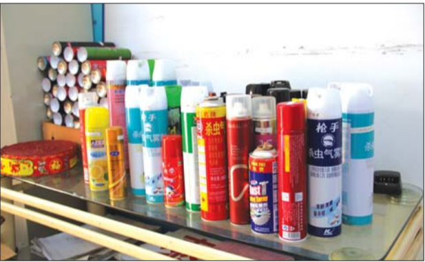
泰山汽车站,近期查获的违禁物品。

客登记后,把菜刀保存起来。据了解,进入5月份以来,该站已经检测到100多件禁止携带的物品,“每件物品我们都贴上标签,暂时替乘客保管,乘客回泰安时再联系车站将物品带走。”