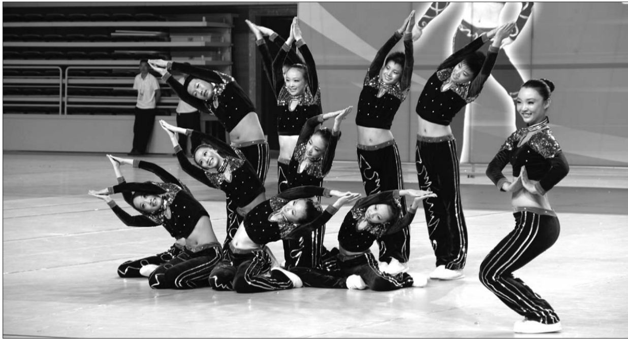
健身操运动员在专心比赛。

在16日-17日的比赛中,淄博代表队以14块金牌,336的积分位居第一名,滨州代表队以9金,积分293的成绩位居第二,潍坊代表队则以4金积分206的成绩暂居第三。踢毽子和体质测试则将于20日-21日分别在滨州体校综合训练馆和滨州北镇中学举行。