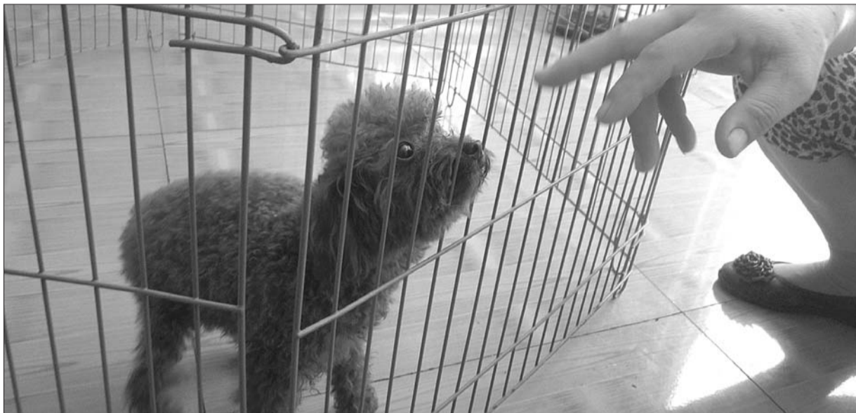
一宠物店里的泰迪犬。

8月12日起,烟台市芝罘区将对全区范围内犬只进行为期一个月的集中整治,要求城市建成区的犬只进行集中免疫、电子注册和办理犬只准养证。19日、20日,记者走进位于烟台幸福南路的狗市,发现这里的店家大都是无证经营。