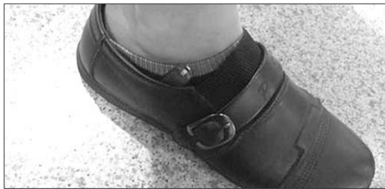
鞋子中藏匿瑞士军刀。