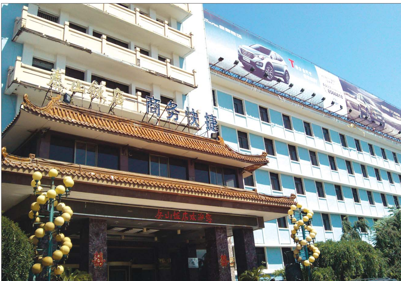
有着30多年历史的三星级泰山饭店挂出了“商务快捷”的牌子。