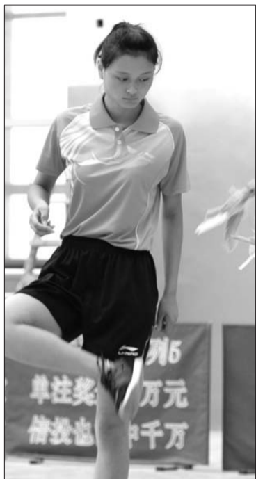
踢毽子运动员正在比赛中。

本报8月20日讯(记者 谭正正 张牟幸子 通讯员 王蕾) 山东省第十二届中学生运动会中健身操、跳绳、轮滑项目的比赛已经率先圆满落幕。五大比赛项目仅剩的踢毽子与体质测试,也于20日上午8点半分别在滨州体育馆和滨州北镇中学举行。在20日上午的踢毽子4个决赛中,滨州代表队获得可喜的成绩,囊括了初、高中组男子单人踢毽冠军。