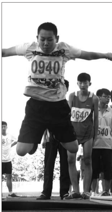
立定跳远运动员起跳腾空。

另外,在21日的比赛中,踢毽子比赛将迎来三人轮踢的项目。体质测试比赛的项目包括高中组男、女子坐位体前屈,初、高中女子800米、初、高中男子1000米的比赛项目。