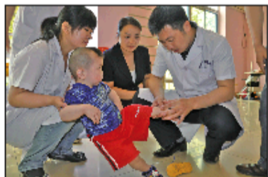
为市儿童福利院孩子们免费复健。

东昌府区妇幼保健院康复科是聊城市规模最大的儿童康复中心,拥有医护人员90余名,各种训练、测评仪器设备百余件,日均门诊量600余人次。下设斜视治疗室、矫形室、PT治疗室、OT治疗室、ST治疗室、感统训练室、中药熏蒸室、中医推拿室、针灸室、理疗室、特设发育评估室。对儿童发育迟缓、脑性瘫痪、智力低下、感统失调以及斜视、先天性马蹄足、先天性髋关节脱位等儿童常见病有着丰富的临床经验,特别是斜视和脑瘫的治疗,采用独特的治疗手法和干预方法配合,效果好,花费少,深受广大患者好评,影响力辐射到周边省市。康复热线:8463069