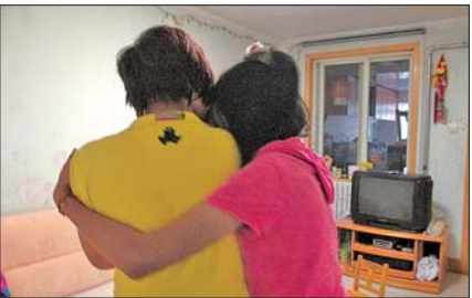
▲乐乐抱着妈妈,安慰妈妈。