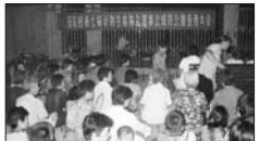
召开计生协直推直选大会