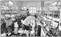
城头农信社助力计生户发展“家庭工厂”