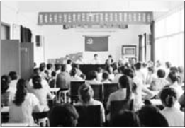
召开计生村民自治兑现奖惩大会