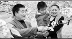
城头农信社为计生户致富“加油”