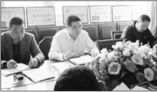
召开人口基础信息核查会议

平台,并健全与当地计生办等组织联系沟通渠道,借助计生办等组织力量物色筛选计生种养户、多种经营户、个体工商户进行有针对性扶持,打造成功典型,并以点带面,通过典型引路带动更多计生家庭就业致富,尤其是对特色村、特色产业进行帮扶,帮助其扩大种养殖业和个体经营,确保惠及全镇各个计生家庭。(王洪刚 王逢营)