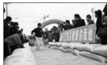
举办计生趣味运动会