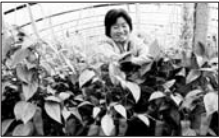
城头农信社助力计生家庭发展红椒生产