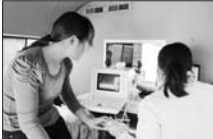
计生“流动服务车”开进村