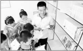
留守儿童“计生书屋”里充电。