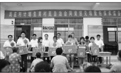
表彰计划生育模范家庭

创业热情,树立新的就业、创业观,营造出自主创业、增收致富的良好氛围,进而扩大了城头农信社的社会影响力,提升了良好社会形象。(王洪刚 王逢营)