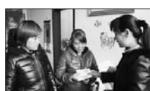
入户发放新农合医疗费