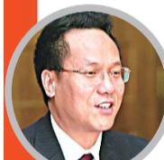
冉新权 中石油股份原副总裁 长庆油田原总经理

由纪检、组织、审计、监察、人力资源社会保障和国有资产监督管理等部门组成,主要职责是研究制定有关经济责任审计的政策和制度,监督检查、交流通报审计工作开展情况。