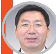
李华林 中石油原副总经理 昆仑能源董事会原主席

此次,蒋洁敏涉嫌严重违纪接受调查。一位中石油内部人士表示,公司内部此前对蒋洁敏被调查一事已有猜测。“蒋总的离任审计本来就三个月,结果多半年了还没结束,当时大家就猜测有问题。”