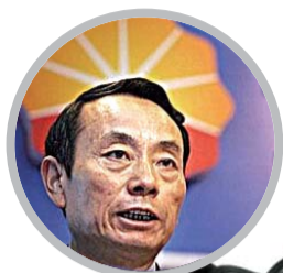
国资委主任蒋洁敏 曾任中石油董事长

任职国资委主任不到半年的蒋洁敏目前已被免职。在此之前几日,先后落马的4名中石油高管也“是被蒋洁敏的离任审计所牵发”。