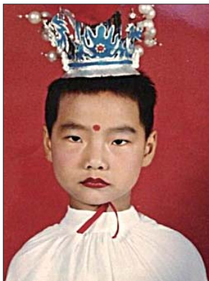
▲ 网友争晒童年囧照。