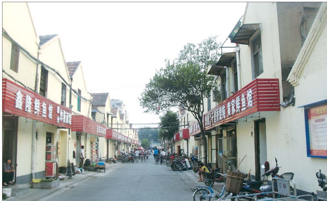
常青路中心街整治了不少。

督导组离开后,洸河街道对辖区内的老旧小区堆放的杂物进行集中清理,对楼道内的小广告及时清除,并设立了专门的宣传栏。同时整理、清扫小区过道,重新粉刷了外围的墙面。