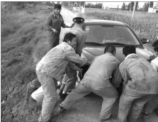
滨南采油厂作业大队作业5队队员把车抬上马路。

经过二十分钟的努力,轿车终于被抬至路面,脱离了险境。车主连声道谢,并提议大家到家中坐坐喝口茶。但大家还是以上井接班为由婉言谢绝了。