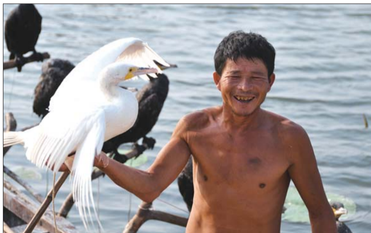
老吕说，白色鱼鹰在微山湖仅此一只，这让他颇为得意。