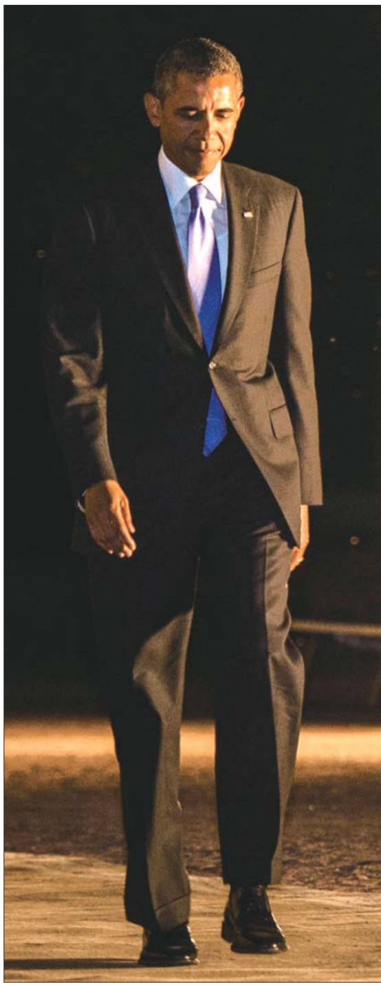
5日晚,圣彼得堡,美国总统奥巴马在出席G20峰会第一阶段会议后,准备出席工作晚宴。

美国国务院这项举措应与奥巴马上周宣布考虑对叙利亚采取军事行动有关。黎巴嫩是叙利亚邻国,黎巴嫩真主党坚定支持叙利亚政府。美方在声明中提及贝鲁特及周边涉及真主党及其他团体的暴力或犯罪行为。综合新华社消息