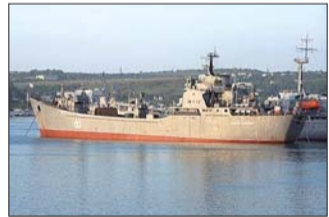
“尼古拉·菲利琴科夫”号大型登陆舰。(资料片)

俄国防部8月29日确认,海军9月初将对部署在地中海的军舰展开正常轮换,“潘捷列耶夫海军上将”号大型反潜舰、“明斯克”号和“新切尔卡斯克”号大型登陆舰等舰艇将进入这一水域执行任务,但没有提及“尼古拉·菲利琴科夫”号。