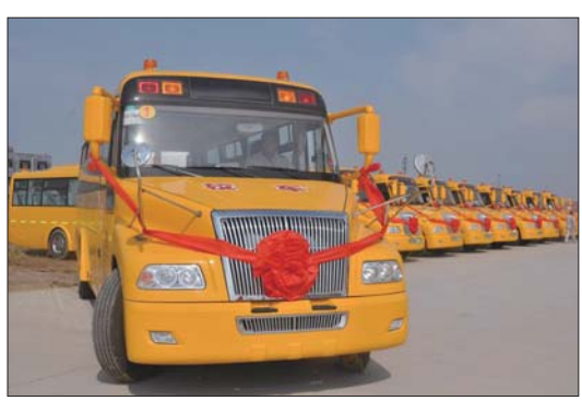
汇泰集团投资500万元为学校购置了14辆“大鼻子”校车。