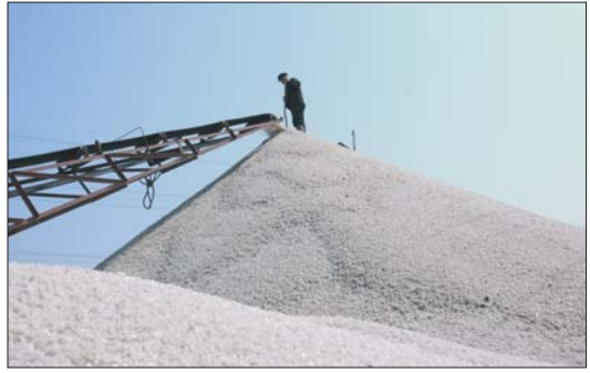
百万吨海盐生产基地。