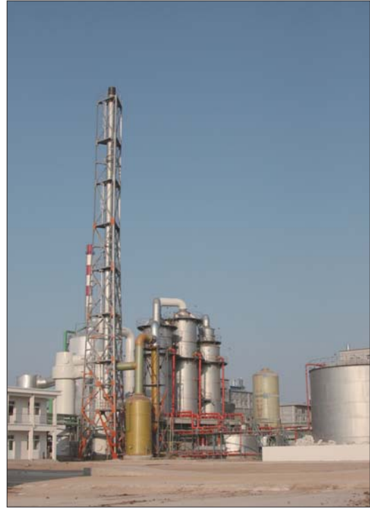
磷化工及综合利用项目。