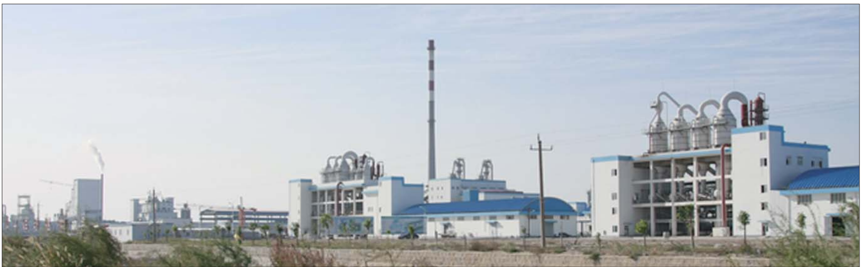
汇泰蓝色经济产业园。