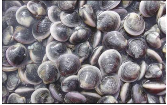
养殖基地里的青蛤。