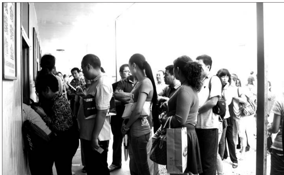
报名窗口前排起长队。

“红西佳苑共有162套经适房,符合标准的申请人分别为凤凰怡居佳苑小区未摇中号的以及摇号候补号家庭和其他轮流家庭,共2000户。”济宁市房管局住房保障科科长李忠利说,报名将一直持续到9月17