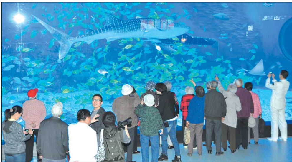
鲸鲨馆里的鲸鲨等明星吸引了大量游客前来参观。

此次活动得到了烟台市老龄工作委员会的大力支持,旨在在全市形成“常回家看看,关爱空巢老人”的爱老、敬老良好风气,通过丰富多彩的活动增强老年人的体