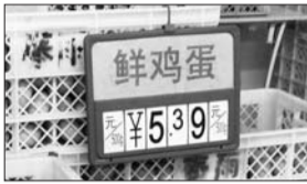
振华超市 蛋价: 5.39/斤