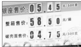
银座超市 蛋价: 5.45/斤