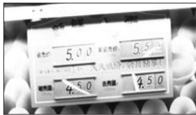
大润发新华店 蛋价: 5.50/斤