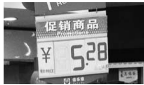
佳乐家福东店 蛋价: 5.28/斤