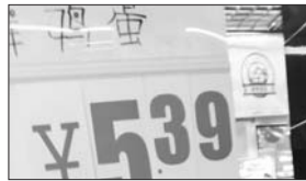
福乐多泰华店 蛋价: 5.39/斤