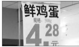
佳世客超市 蛋价: 4.28/斤