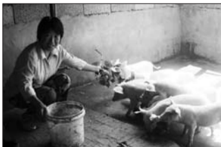
帮扶计生户养殖致富