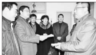
为困难计生职工送慰问金

责任考核到位。 区人口计生局组织工作人员对各镇(街)落实计生奖扶工作进行检查,如发现刻意隐瞒事实,造成错发奖扶金的,由该镇(街)计生办主任和经办人负责追回,对责任人在全区进行通报批评。同时,在年终镇(街)人口计生目标考核中实行倒扣分,严格硬账硬结。