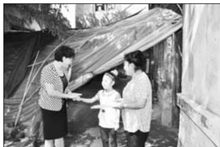
开展金秋助学活动