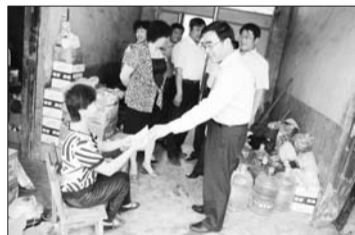
母亲节慰问贫困母亲