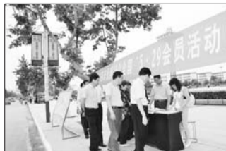
利用节假日宣传奖扶政策