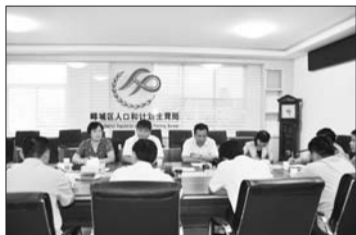
召开会议通报奖扶工作落实情况

建立健全人口和计划生育工作利益导向机制是统筹解决人口问题的有效途径,事关广大计划生育家庭的切身利益。近年来,峰城区把维护和保障计划生育家庭的根本利益作为工作的着力点和切入点,全面落实计划生育各项奖励优惠政策,确保惠民政策惠及广大计划生育家庭。2013年发放各类奖扶金共计9538920元。