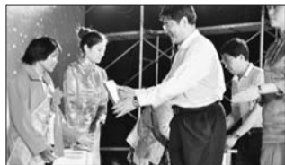
为计划生育幸福家庭颁奖