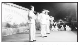
通过文艺节目宣传奖扶政策