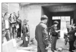
走访核查奖扶金发放情况