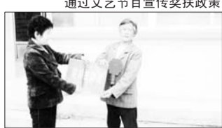
农村六十岁老人拿到奖扶金