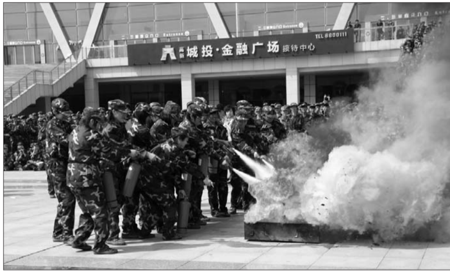
学生们进行灭火器消防演练。

本报9月15日讯(记者 王述 通讯员 陈鼎立 宋杭之)新学期开学之际,为切实增强学校广大师生的消防安全意识和自救能力,9月13日上午,潍坊市公安消防支队宣传员走进潍坊学院体育馆,为该校2013级入学军训新生讲授了一堂丰富生动的消防安全知识课。潍