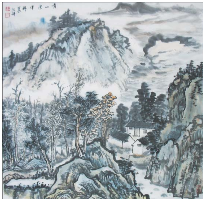
① 沈耕花鸟作品 ② 春山晴晓 ③ 满目青山尽是情 ④ 青山云常伴