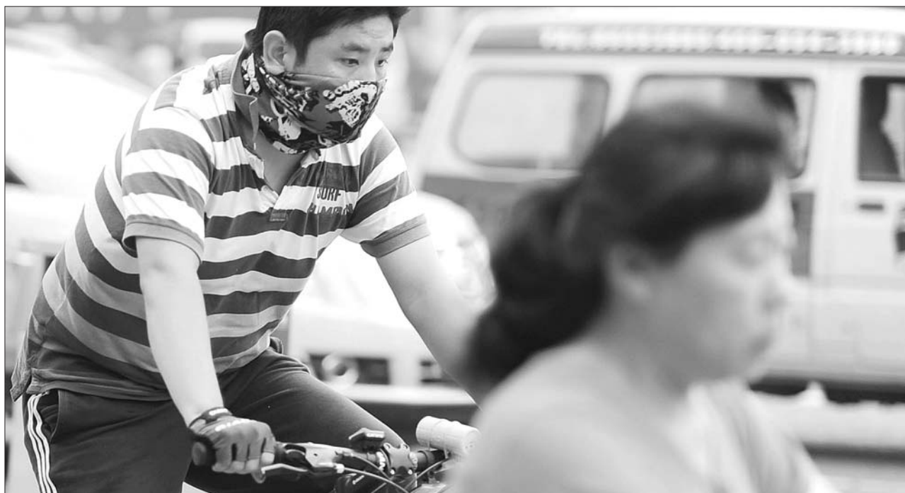
22日,济南空气质量仍很差,历山路上一名年轻人戴着口罩骑车在人流和车流中穿行。